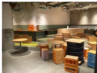
Hakata9 試食・商品プレゼン・ プチマルシェ会場