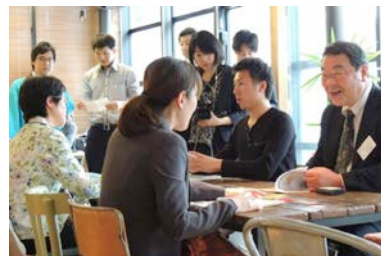
マッチング商談会 ※イメージ画像