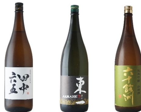
&lt; 参考画像 &gt;