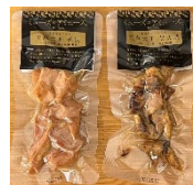
ミューズのアミューズ 天草大王 炭火焼・燻製