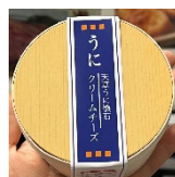
天草うに懐石 クリームチーズ