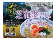
芝海老だしらーめん