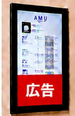
縦型サイネージ(連絡通路)