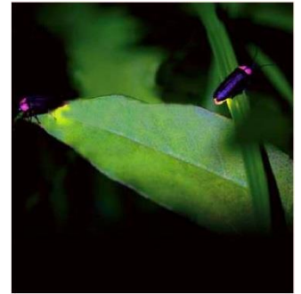
〈昨年のホタル観賞の様子〉