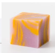
※石鹼の色はイメージです