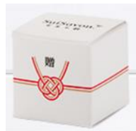
CUBE石鹼は特別1個箱付き