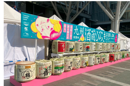
2026年3月 九州酒蔵びらき2026 (博多駅前広場)