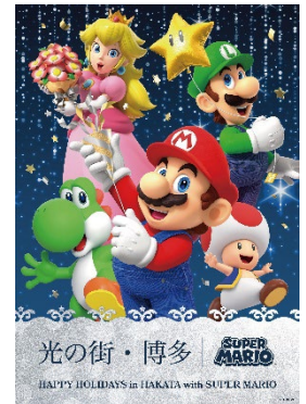
ホリデーシーズン メインビジュアル