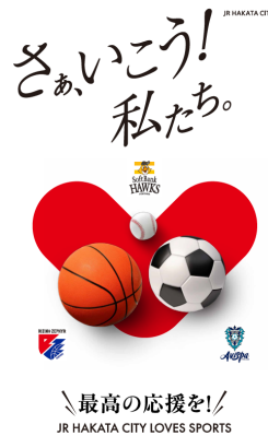
スポーツ応援 3チーム合同ビジュアル