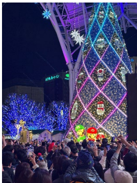
マリオとルイージをゲストにむかえた 点灯式の様子