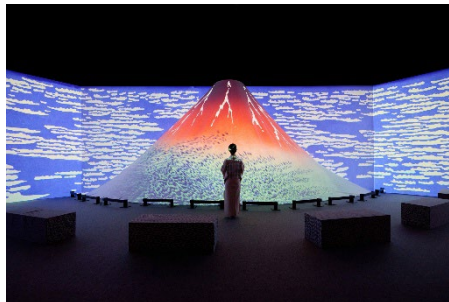
2025年6月 動き出す浮世絵展 福岡 (JR九州ホール)