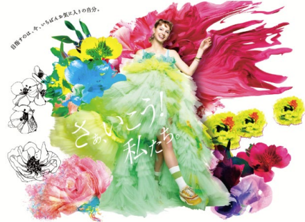
2025年度テーマ「さあ、いこう！ 私たち。」 メインビジュアル